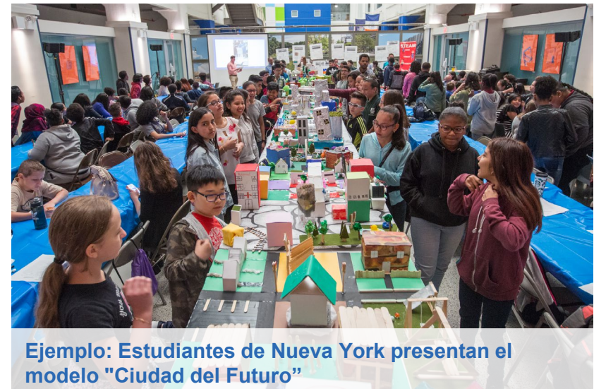
Ejemplo: Estudiantes de Nueva York presentan el modelo "Ciudad del Futuro"

Indicaciones: Utilice los materiales de manualidades para crear su casa, edificio, parque, área de juegos o lo que desee. Trabaje en grupo o individualmente.