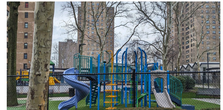
Nueva área de juegos en Independence Towers