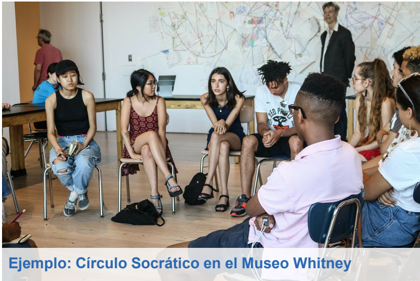
Ejemplo: Círculo Socrático en el Museo Whitney

Indicaciones: Escoja un asiento en el círculo, preséntese y participe en un debate respetuoso, abierto y reflexivo sobre cómo es la vida en Riis Houses.